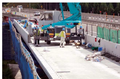
仮設から本設への移動