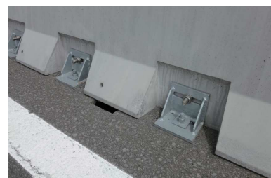
本設固定金具 床板鉄筋に当たらない自在構造