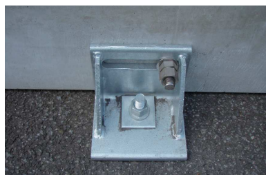
仮設時ずれ止め金具(舗装まで)