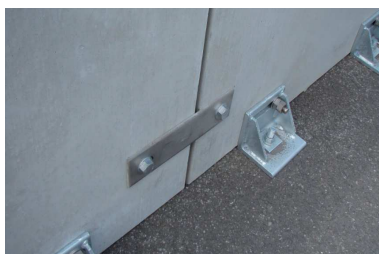
仮設時連結プレート