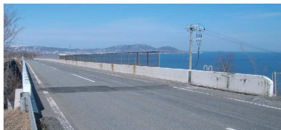
札幌道神威橋 着手前